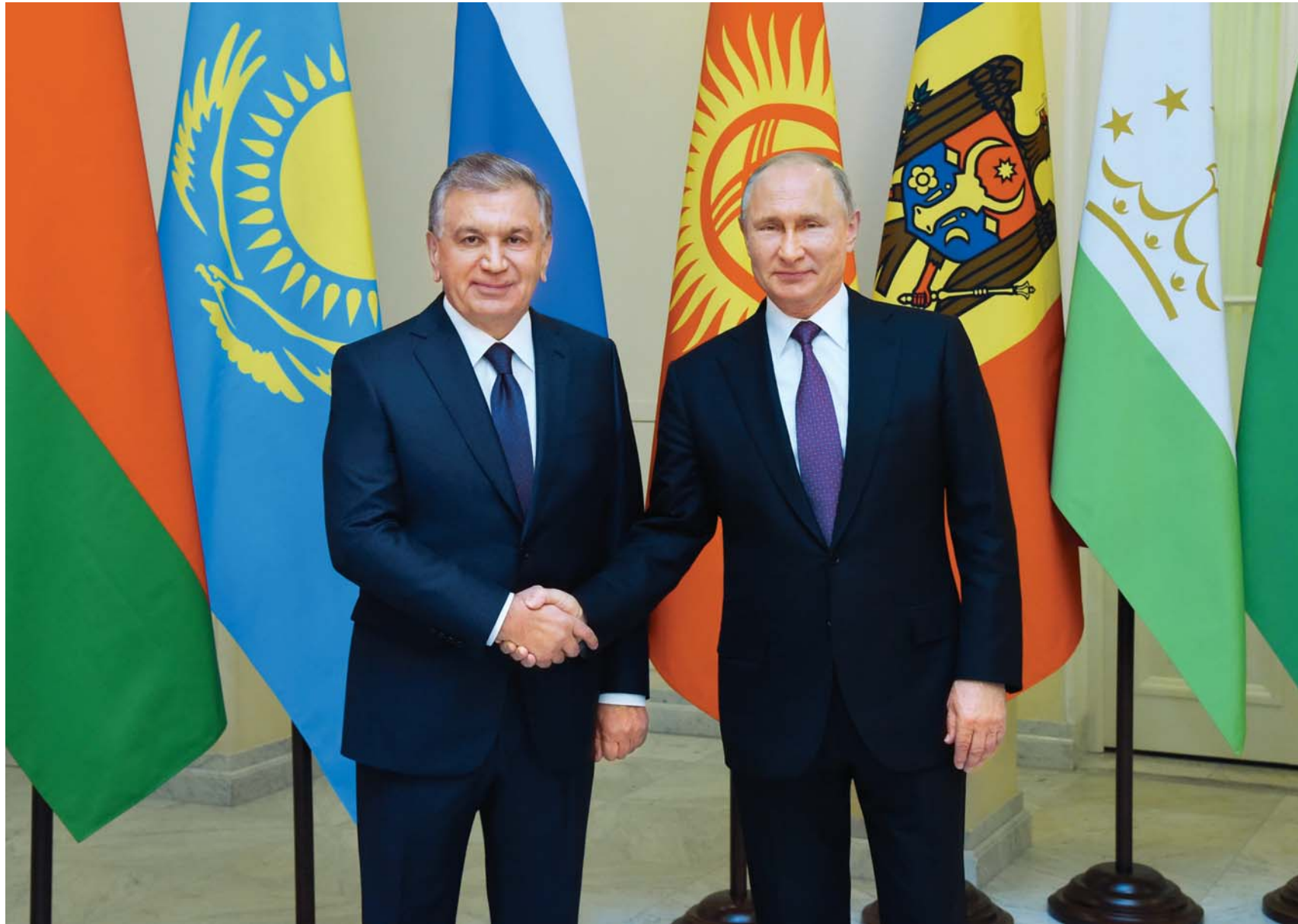
Президент Республики Узбекистан Шавкат Мирзиёев 6 декабря 2018 года принял участие в неформальном заседании Совета глав государств — участников Содружества Независимых Государств в городе Санкт-Петербурге.

Главу нашего государства Шавката Мирзиёева встретил Президент Российской Федерации Владимир Путин. После церемонии фотографирования началась неформальная встреча глав государств — участников СНГ.