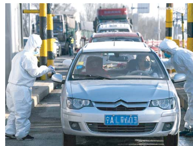
Усиленные противозидемические меры против коронавируса в Китае.

В Узбекистане пристально следят за ситуацией с распространением коронавируса в Китае. О том, что сейчас происходит в Поднебесной, как борются с вирусом и о последствиях эпидемии для экономики и отношений с Узбекистаном, беседа нашего корреспондента с Чрезвычайным и Полномочным Послом КНР в Узбекистане Цзян Янь.