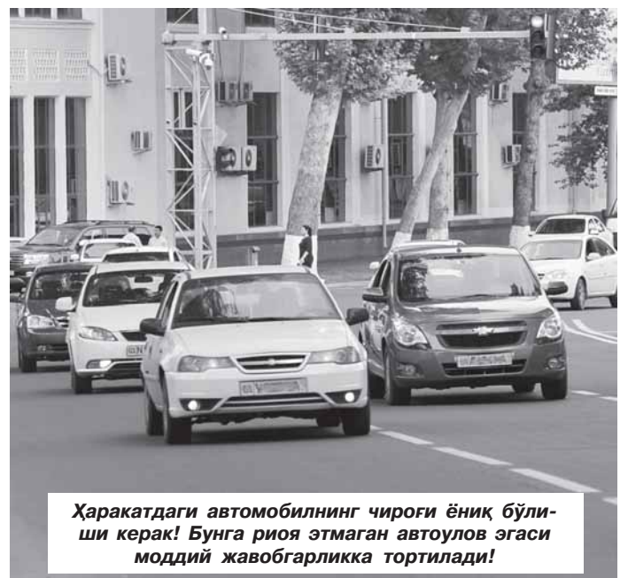
Ҳаракатдаги автомобилнинг чироғи ёниқ бўлиши керак! Бунга риоя этмаган автоулов эгаси моддий жавобгарликка тортилади!

УЧИНЧИДАН, ЙЎЛ ҲАРАКАТИ ҚОИДАЛАРИНИНГ 41-БАНДИГА КИРИТИЛАЁТГАН ЎЗГАРТИРИШЛАР ШУ ПАЙТГАЧА АХОЛИ