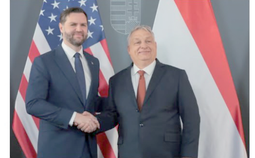
With friends like these, JD Vance's visit to Hungary appears to have damaged Viktor Orbán's hopes of being re-elected

After 16 years in power, being an icon of the far right may finally backfire for the country's leader in today's election