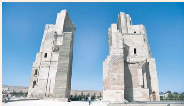
Дискуссия на тему «Быть Шахрисабзу в списке ЮНЕСКО или нет?» не угасает уже несколько лет. Возникла она после того, как в 2014 году в городе с многовековой историей началась масштабная реконструкция, изменившая облик исторического центра до неузнаваемости.