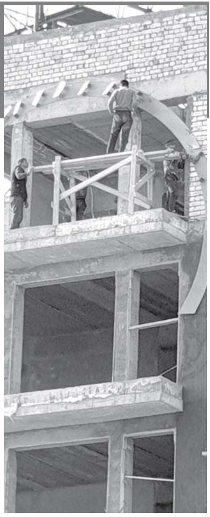
Собир АЛИЕВ, «Народное слово».

ности, значит, этот контроль осуществляется не на должном уровне. Или у кого-то из организаций, контролирующих соблюдение правил охраны труда на строительных объектах, другое мнение?