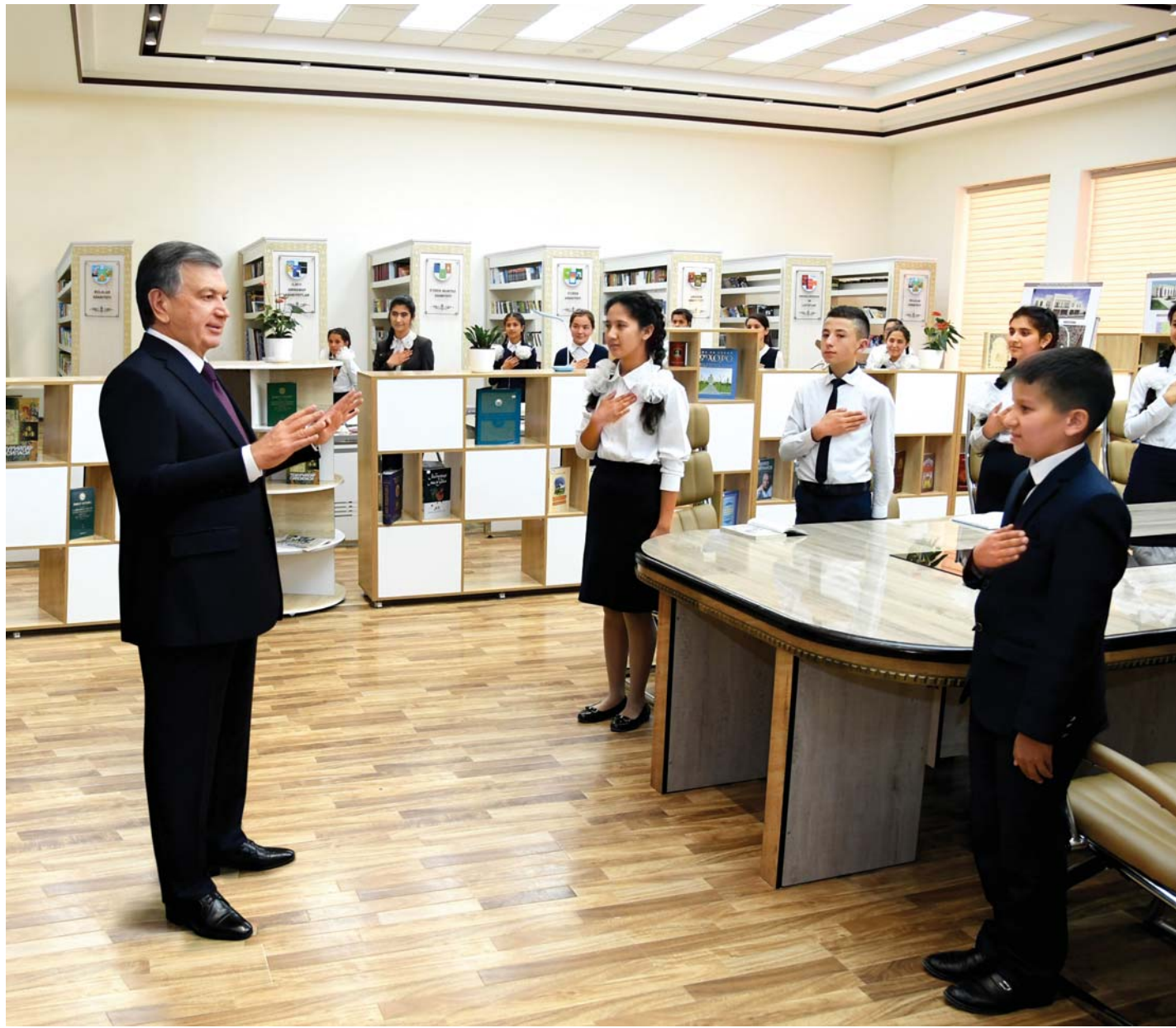
Президент Республики Узбекистан Шавкат Мирзиёев в целях ознакомления с осуществляемой созидательной работой, крупными проектами на местах и диалога с народом 29–30 марта посетил Бухарскую область.

Во второй день визита Президент Республики Узбекистан Шавкат Мирзиёев провел совещание актива по вопросам социально-экономического развития Бухарской области. В собрании, прошедшем в форме видеоконференц-связи, приняли участие актив области, депутаты, руководители государственных и общественных организаций, хокимы городов и районов, ветераны, молодые предприниматели, представители широкой общественности.