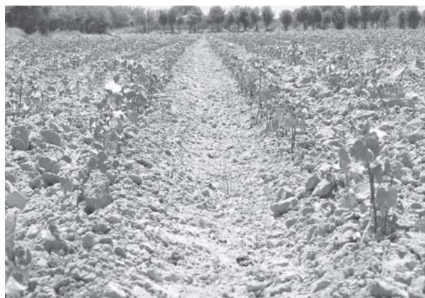
отключения электроэнергии пропадает труд, потраченный на выращивание сырца.

Фермеры растеряны и не совсем понимают, как в этом году им справиться с критической ситуацией. Из-за нехватки воды и отключения электроэнергии пропадает труд, потраченный на выращивание сырца.