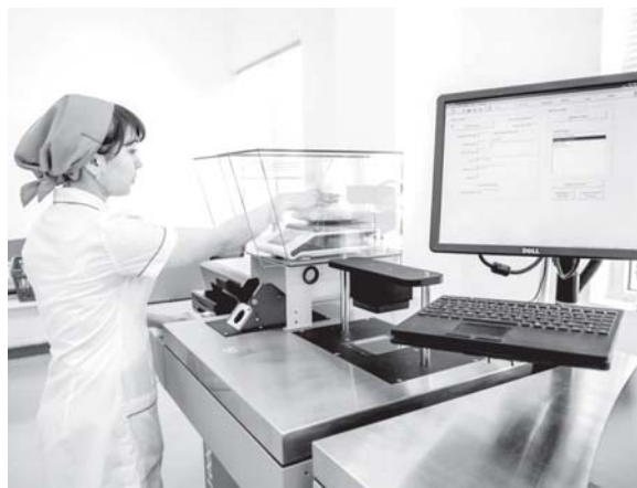
ООО «Fergana Global Textile», где также дислоцируется цех по изготовлению смешанной и кардной пряжи. Но здесь, чтобы все

производителей из Швейцарии, Италии, Германии, Великобритании, Израиля и Турции. Высоко оценивается и экспортный потен-