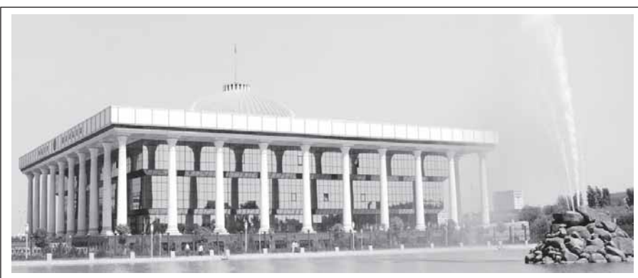
Муҳокамалардан сўнг, қонун лойиҳаси қабул қилинди.

ишлайдиган моддалар киритилди. Лойиҳа фазовий маълумотларни яратиш ва улардан фойдаланиш, Фазовий маълумотлар миллий инфратузилмасини яратиш, қўллаб-қувватлаш ва ривожлантириш соҳасидаги муносабатларни тартибга солиш мақсадида ишлаб чиқилган. Бу, ўз навбатида, иқтисодиётнинг барча соҳаларида рақамлаштириш ва инновацион ахборот-коммуникация технологияларидан фойдаланган ҳолда географик ахборот тизимлари, веб-порталларни ва навигация хариталарини шакллантириш ҳамда улар ёрдамида аҳолига ва тадбиркорлик субъектларига давлат хизматлари ва бошқа турдаги хизматлар кўрсатиш, ушбу соҳада хусусий сектор томонидан кўрсатиладиган хизматларнинг тақомиллаштириш ва иқтисодиёт тармоқларининг ривожланишига имкон яратди.