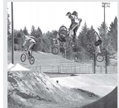
BMX Supercross — один из видов велосипедного спорта, появившийся в Калифорнии в начале 70-х годов прошлого столетия. С 2008 года данная дисциплина включена в программу Олимпийских игр.

По данным Национального олимпийского комитета, проектированием трассы будут заниматься зарубежные специалисты. В эти дни представители хокимията Джизакской области, выступившего инициатором проекта, совместно с руководством Федерации велосипедного спорта Узбекистана изучают территорию, где будет построена трасса. По предварительным расчетам, ее открытие планируется на сентябрь текущего года.