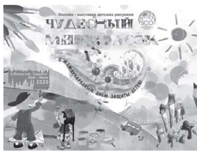
циональным традициям и обычаям стран ШОС, а также красоте окружающего мира и родного края, любви к родине, мечтам о мирном и счастливом будущем на земле.

При отборе рисунков учитывались оригинальность, художественное мастерство и раскрытие темы на выбор. Юные художники посвятили свои работы ценностям дружбы и семьи, искусству, фольклору, природе, на-