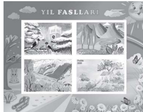
вых марок по рисункам победителей. А почтовые марки, изготовленные с участием юных узбекистанцев, разлетятся по всему миру, будучи наклеенными на тысячи писем и бандеролей.

В июне в Центральном выставочном зале Дирекции художественных выставок планируется выставка детских рисунков и презентации почто-