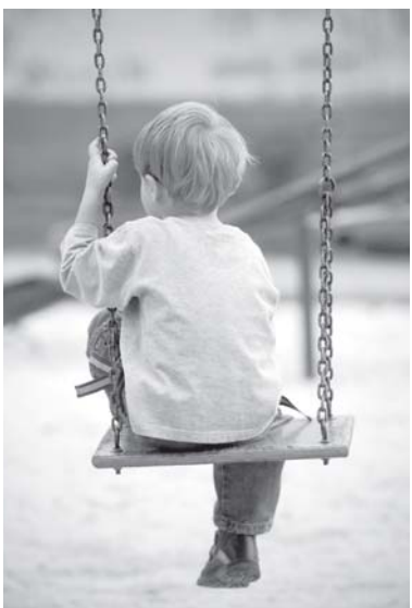
Трудоустройства детей-сирот и детей, оставшихся без попечения родителей.

Особое внимание уделяется обеспечению полезного досуга детей. Квалифицированные специалисты обучат воспитанников навыкам программирования. Создаются условия для прохождения производственной практики учащихся 10—11-х классов в ведущих организациях по направлению «информационно-коммуникационные технологии». Кроме того, будет установлен механизм системного мониторинга