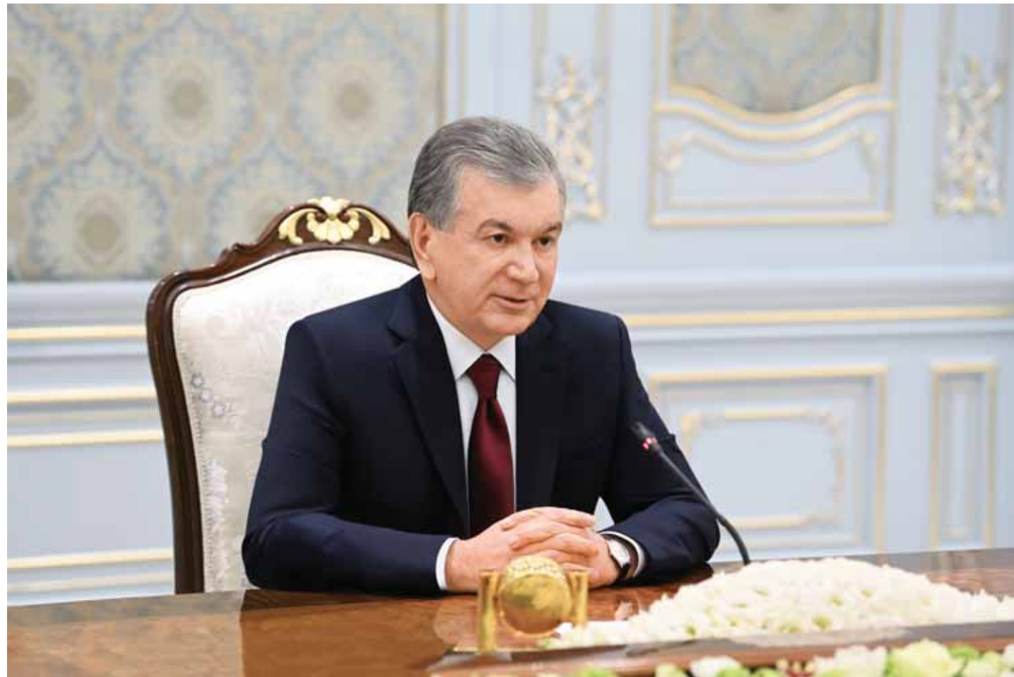
Ўзбекистон билан Қозоғистон ўртасидаги кўп қиррали ҳамкорлик муносабатларини янада ривожлантириш ва кенгайтириш масалалари муҳокама қилинди. Учрашув аввалида Бош вазир Алихан Смаилов

Ўзбекистон Республикаси Президенти Шавкат Мирзиёев 11 февраль куни мамлакатимизга амалий ташриф билан келган Қозоғистон Республикаси Бош вазири Алихан Смаиловни қабул қилди.