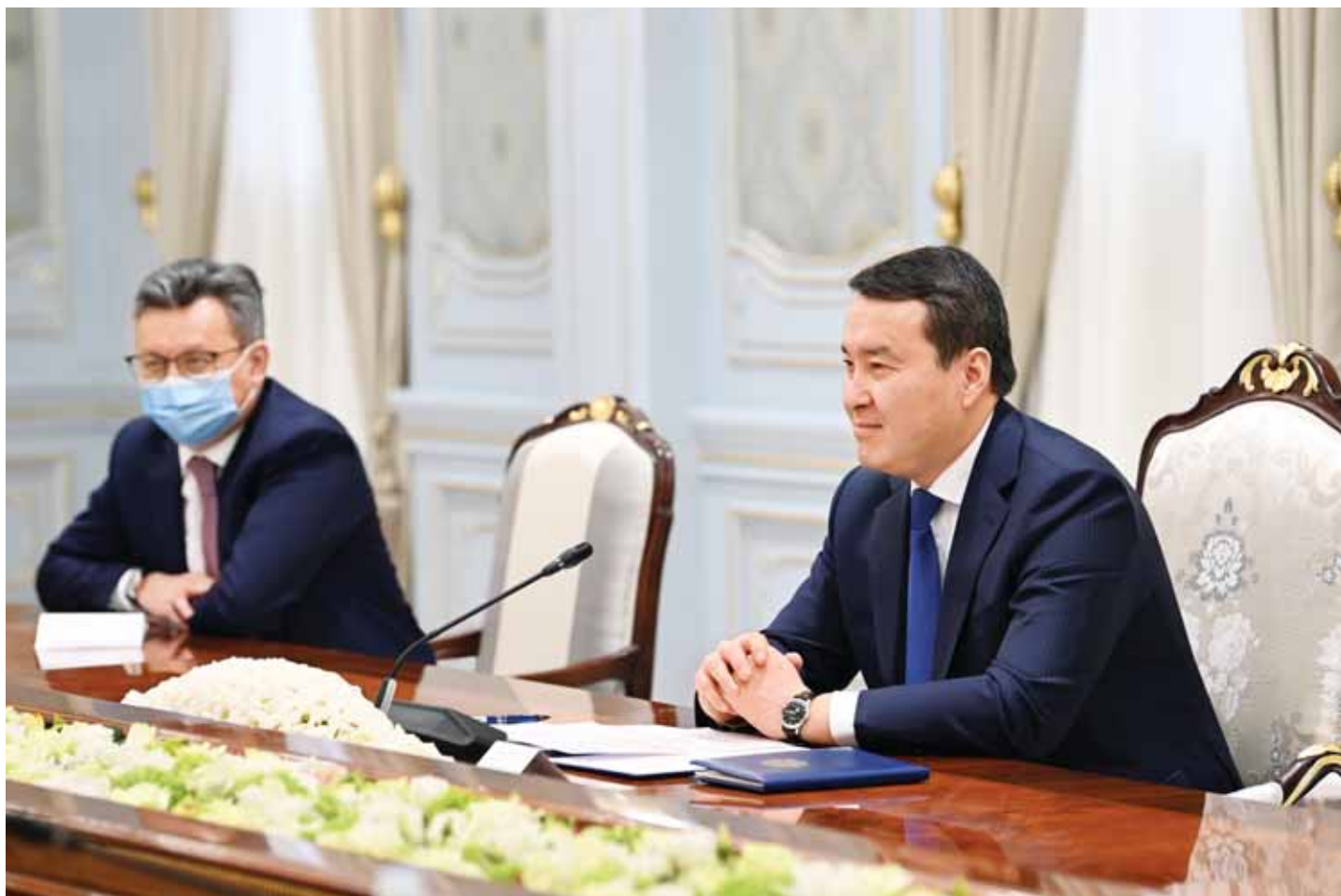
қулай шарт-шароитлар яратиш, янги соноат кооперацияси ва логистика марказлари ташкил этишни жадаллаштириш, сув, энергетика ва транспорт-коммуникация соҳаларида ўзаро манфаатли ҳамкорликни кенгайтириш, ҳудудлараро мулоқотлар ва