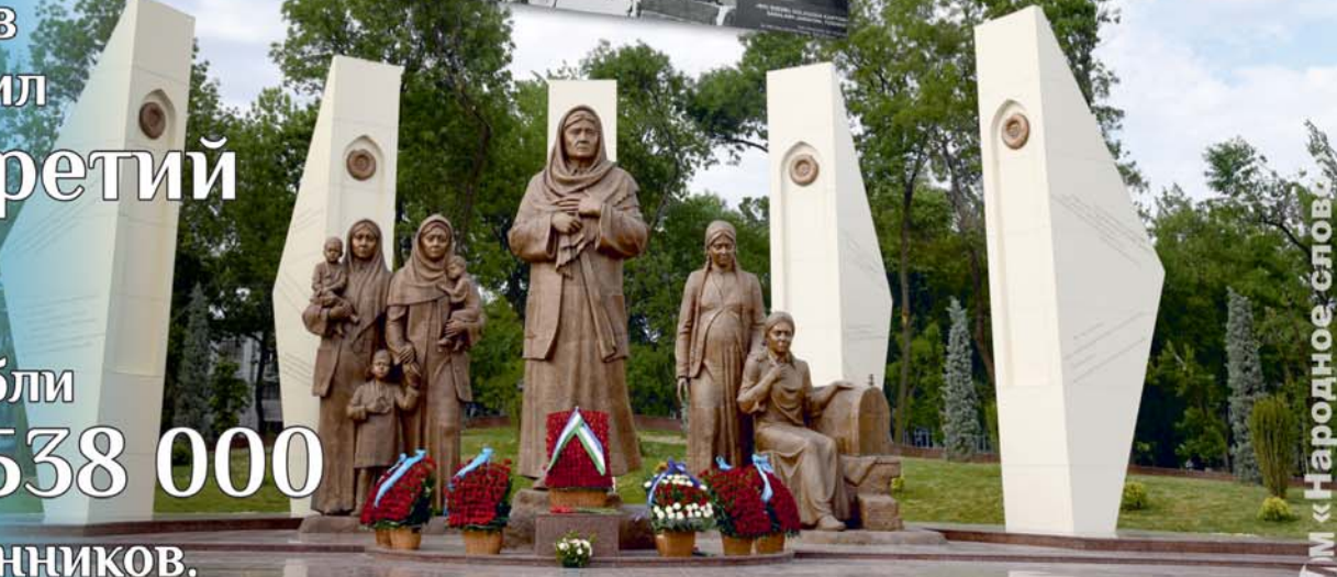
СМ «Народное слово»