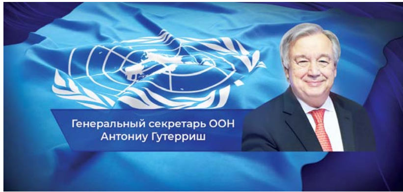
Генеральный секретарь ООН Антониу Гутерриш