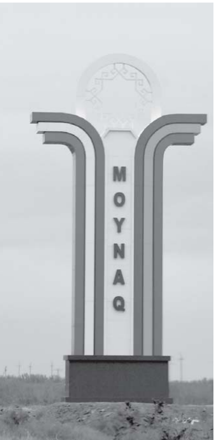
Особое значение в стране придается реализации намеченных мер по улучшению условий жизни в Приаралье. В частности, в Муйнакском районе будут возведены современные жилые дома, отвечающие всем требованиям, производственные и социальные объекты, создана необходимая инфраструктура. Когда я в очередной раз приезжаю в регион, то вижу большие изменения к лучшему.

гектаров. Многие, как и я, видели впечатляющую картину, когда по бывшему дну Арала широким фронтом движутся десятки пахотных и пропашных тракторов, доставленных из всех регионов республики. Они задействованы в нарезке борозд и посадке семян саксаула на глубину более 50 сантиметров, то есть соблюдаются все агротехнические мероприятия. Это дает уверенность в том, что через несколько лет на месте Аралкума появятся настоящие саксауловые леса, которые остановят пыльные бури.