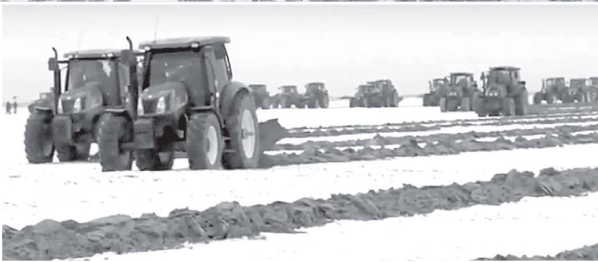
Международное сообщество откликнулось на инициативы лидера Узбекистана. По инициативе нашего Президента при ООН создан многопартнерский Трастовый фонд по человеческой безопасности для региона Приаралья, в который уже поступают средства от доноров из разных стран на реализацию проектов по улучшению условий жизни проживающих там людей.

Вторая причина того, почему, зная о негативных последствиях для Арала, все же шли на масштабное освоение земель и огромные затраты вод-