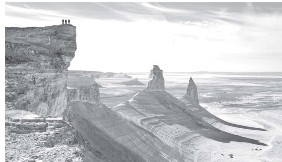
Арал, увы, не вернуть. Не только в Узбекистане, но и в других странах нужно хорошо усвоить уроки аральской трагедии, понимать, к чему может привести деятельность человека, пусть даже и с самыми благими намерениями.

— Я считал и считаю до сих пор это большой ошибкой. Я был против упразднения Минводхоза. Но, увы, повлиять на это решение не смог. Рад, что Президент Шавкат Мирзиёев возродил Министерство водного хозяйства, перед которым поставил самые серьезные задачи. Не хочу никого критиковать, но нам, ирригаторам, было больно видеть, как годами оставалось без должного внимания и приходило в упадок все то, что создавалось упорным трудом на протяжении многих лет. В результате имеем мелиоративное ухудшение на 600 тысяч гектаров, а 200 тысяч гектаров вообще вышло из оборота. А что такое 200 тысяч гектаров для Узбекистана? Это огромное количество недополученной сельхозпродукции, которая