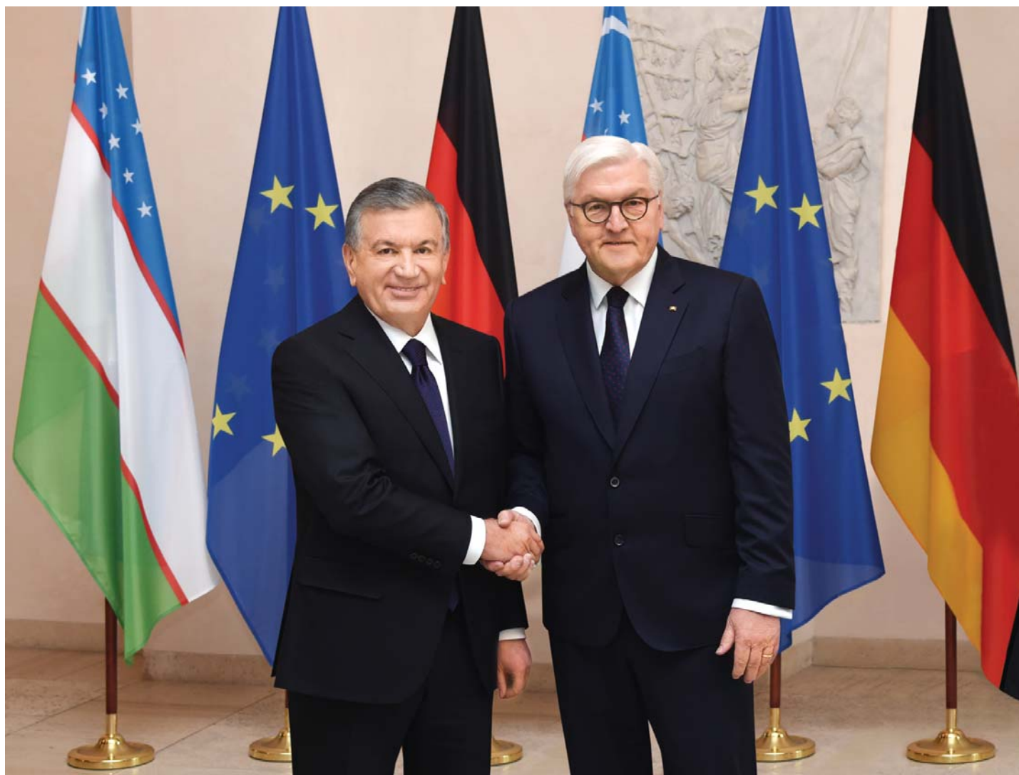
Президент Республики Узбекистан Шавкат Мирзиёев и Президент Федеративной Республики Германия Франк-Вальтер Штайнмайер.

Президент Республики Узбекистан Шавкат Мирзиёев 20 января 2019 года по приглашению Федерального канцлера Федеративной Республики Германия Ангелы Меркель прибыл с официальным визитом в эту страну.