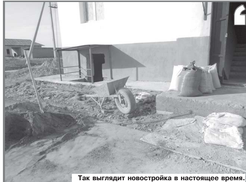
Так выглядит новостройка в настоящее время.