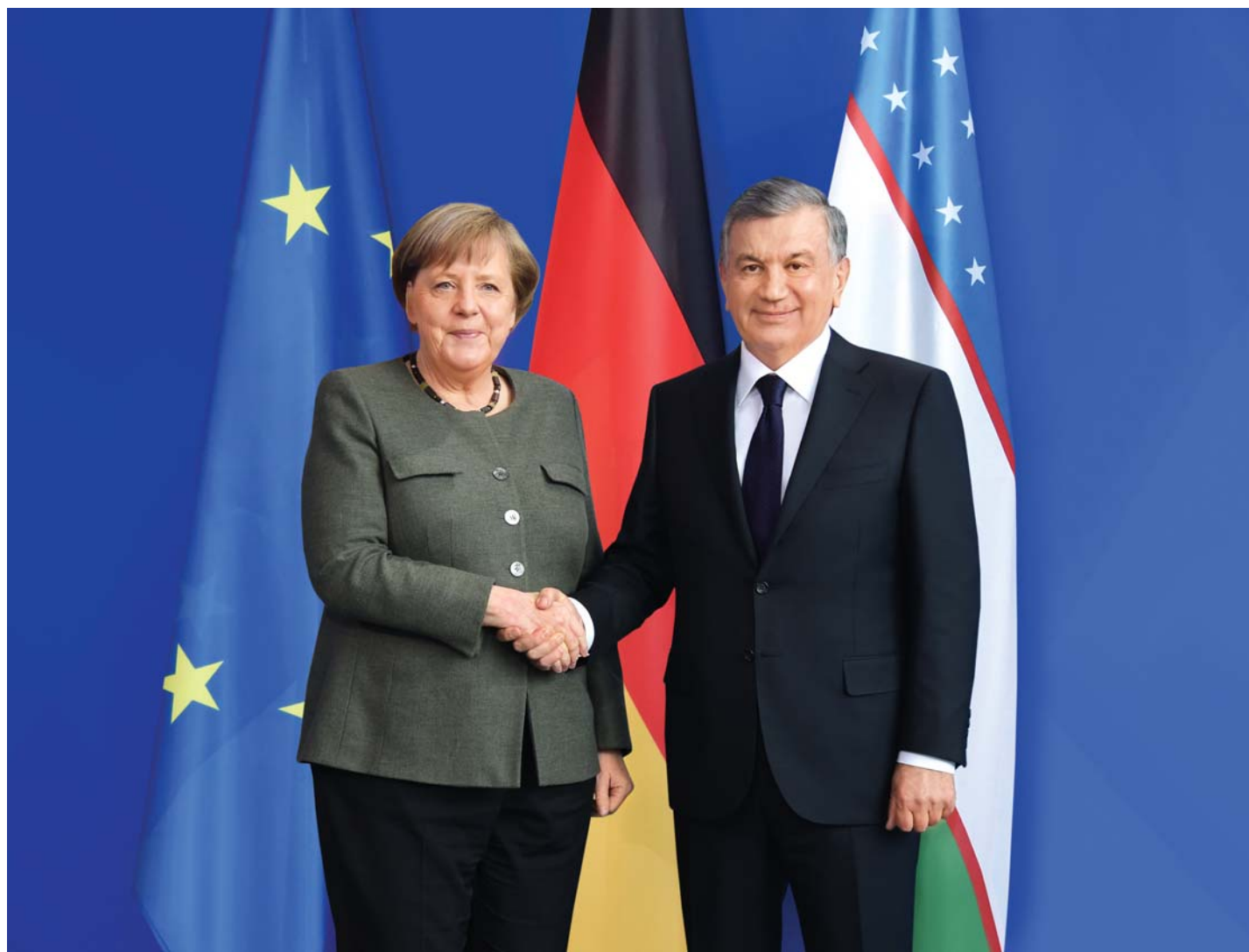
Президент Республики Узбекистан Шавкат Мирзиёев и Федеральный канцлер Германии Ангела Меркель.

21 января во дворце Бельвю в Берлине состоялась церемония официальной встречи Президента Республики Узбекистан Шавката Мирзиёева и Федерального канцлера Германии Ангелы Меркель. Шавката Мирзиёева встретил Президент Федеративной Республики Германия Франк-Вальтер Штайнмайер.