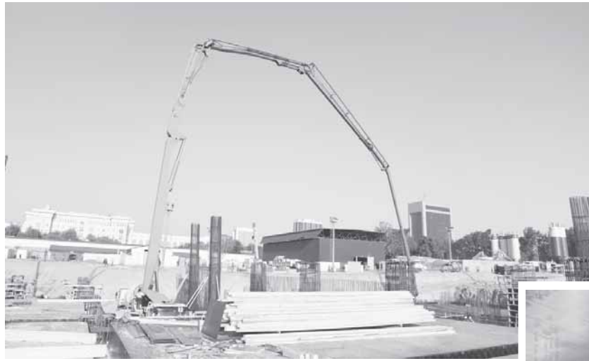
(Давоми. Бошланиши 1-бетда).

шаҳарсозлик ҳақидаги тасаввурларни бутунлай ўзгартириб юборадиган ноёб лойиҳадир