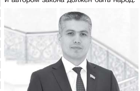
— В настоящее время на столе у депутатов солидный пакет документов для

В числе нововведений общественное обсуждение законопроектов через интернет и социальные сети, учитываются мнения и предложения граждан. Это способствует качественному улучшению их содержания, отражению в них жизненных аспектов, служащих интересам людей. Ведь единственным источником и автором закона должен быть народ.