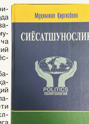
Мусиқимиз Қирғизбоев СИЁСАТШУНОСЛИК

Аминмизки, ушбу китоб олий таълим муассасалари талабалари ва кенг китобхонлар оммаси учун фойдали бўлади.