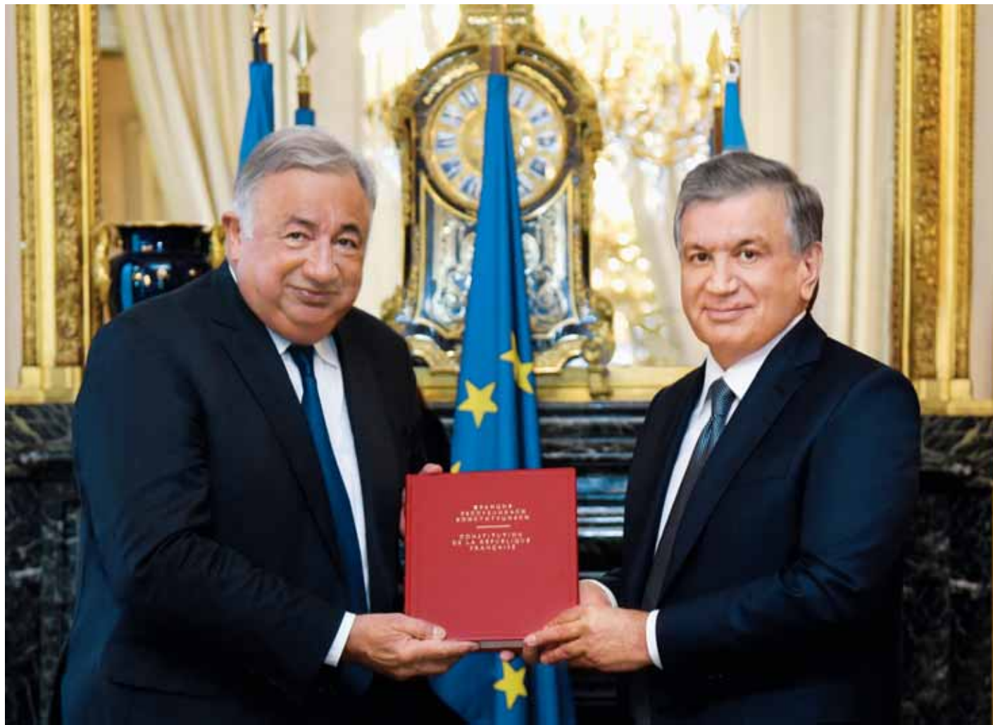
Париж, 8 октябрь. ЎЗА махсус мухбири Абу Бакр УРОЗОВ хабар қилади.

Ўзбекистон Республикаси Президенти Шавкат Мирзиёев Франция Республикаси Президенти Эммануэль Макроннинг таклифига биноан 8 октябрь куни расмий ташриф билан ушбу мамлакатга келди.