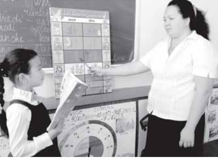
Вильмор мактабга француз олими китобларини топширди.

Самарқанд шаҳридаги мазкур таълим даргоҳига Люсьен Керен номи берилиши муносабати билан ўтказилган маросимда иштирок этган Франциянинг Ўзбекистондаги Фавқулодда ва мухтор элчиси Виолен де