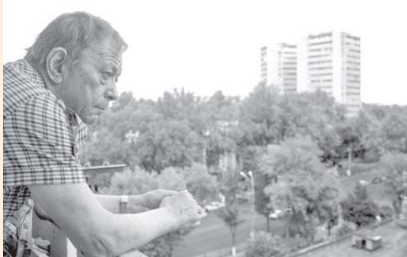
2009 год.

В столице прошли мероприятия, приуроченные к 80-летию поэта Александра Файнберга