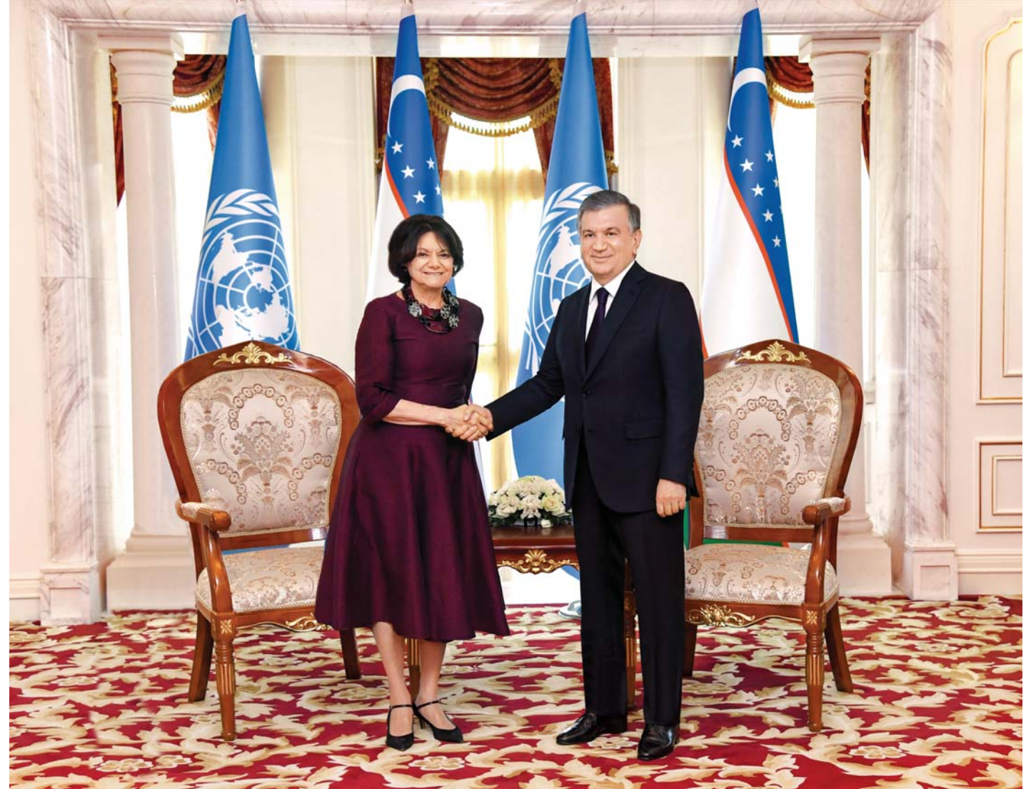
Бишкек, 13 июня. Сообщает специальный корреспондент УзА Зийдулла ЖОНИБЕКОВ.

В международном аэропорту «Манас» главу нашего государства встретил Премьер-министр Кыргызстана Мухаммадали Абилгазиев. Президент Республики Узбекистан Шавкат Мирзиёев встретился с Президентом Кыргызской Республики Сооронбаем Жээнбековым. Глава нашего государства поздравил Президента Кыргызстана с успешным председательством в ШОС. Президенты с глубоким удовлетворением отметили последовательное развитие и укрепление отношений дружбы и стратегического