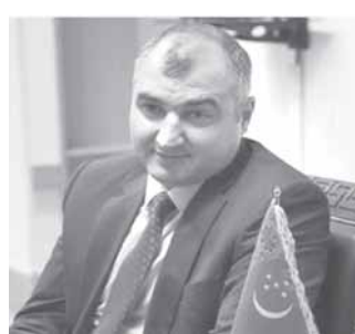
орқали ИХТнинг халқаро майдондаги обрўси ошади.