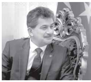
кун тартибидир. Шу нуқта назардан, Ўзбекистон Президентининг ИХТда